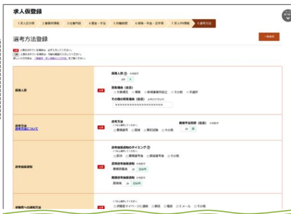
求人申込み（仮登録）の入力画面イメージ